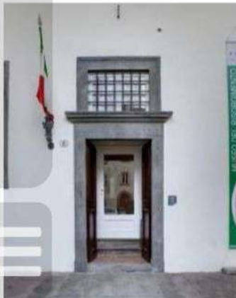
L'entrata del Museo del Risorgimento